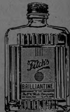
Brillantina, ideal para el peinado

La línea más completa y eficiente al mejor precio