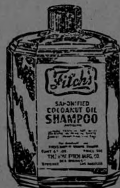
Shampoo al Aceite de Coco, para limpiar y suavizar el pelo