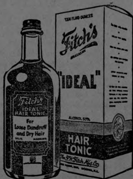
Tónico para fortalecer y embellecer el cabello