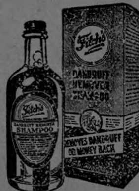
Shampoo eficaz para quitar la caspa