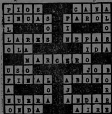
Solución del Crucigrama N.º 36

Vea la solución de este crucigrama N.º 37 en nuestra próxima edición.